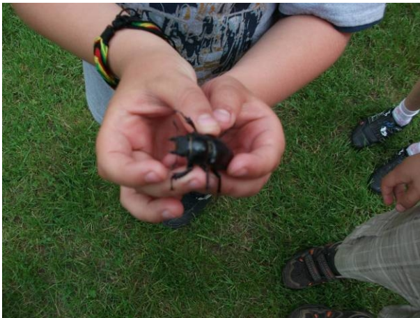
7. Kedvencünk a szarvasbogár