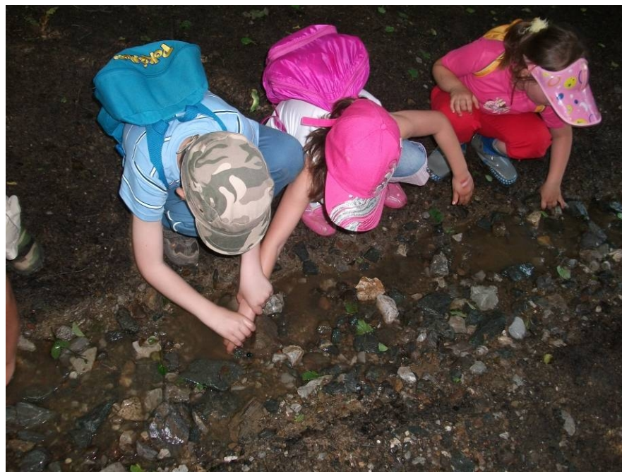
2. Vizi „kincsek” gyűjtése