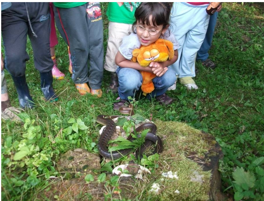
3. Az erdő állatai

A pitypang sok-sok mini ejtőernyőjét nem lehet utolérni. „Szállj- szállj ökörnyal, jön az ősz, megy a nyár.” Keressük az utazó pókokat, így-így tovább, az óvónéni mintájának vonzásában.