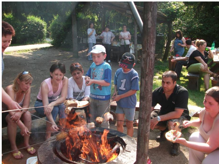
1. Nyársalás a szülőkkel

„erdei ovi” programját – beszélünk a dátumról, érkezés / indulás időpontjáról, a célokról, a tartalmakról, az utazásról, felszerelésről, pénzügyi háttérről.