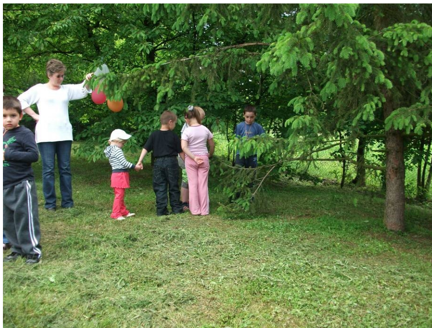
5. Zöldel a fű, rügyeznek a fák

Észre sem vettük a „pettyezetett tüdőfüvet” mert odafelé csak az egyik oldalt néztük.