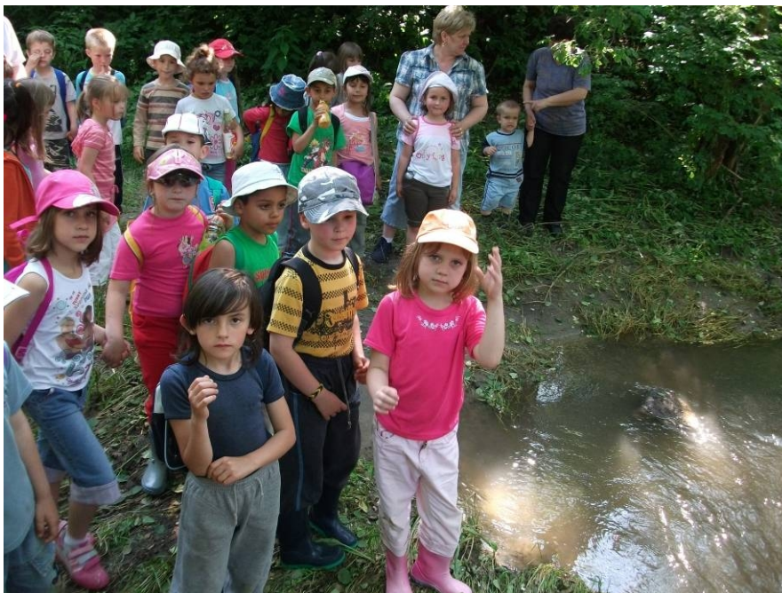
6. Hűsölés a Teréz-forrásnál